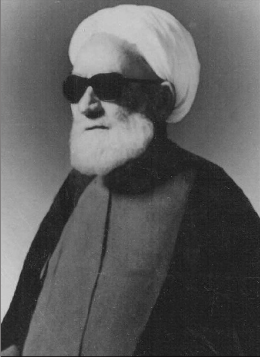
آیت الله محمد خالصی زاده